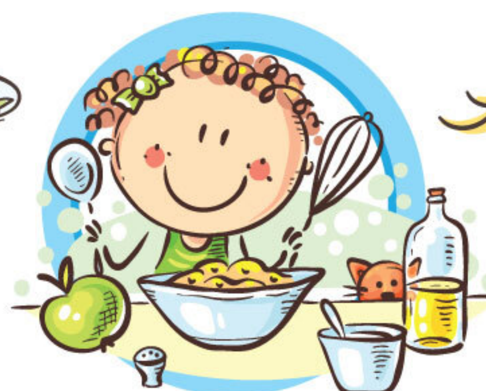
СЛЕДУЙТЕ ПРИНЦИПАМ ЗДОРОВОГО ПИТАНИЯ И ВОСПИТЫВАЙТЕ ПРАВИЛЬНЫЕ ПИЩЕВЫЕ ПРИВЫЧКИ