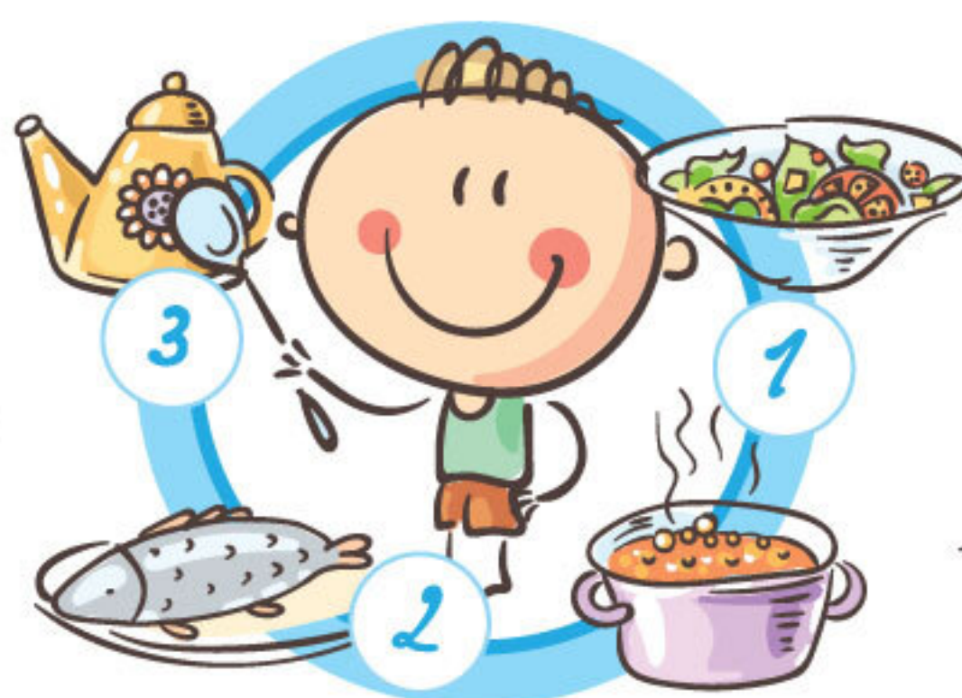
НЕ ПРОПУСКАЙТЕ ПРИЕМЫ ПИЩИ