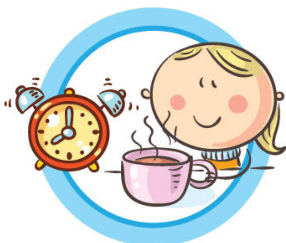
СОБЛЮДАЙТЕ ПРАВИЛЬНЫЙ РЕЖИМ ПИТАНИЯ